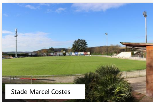
Stade Marcel Costes