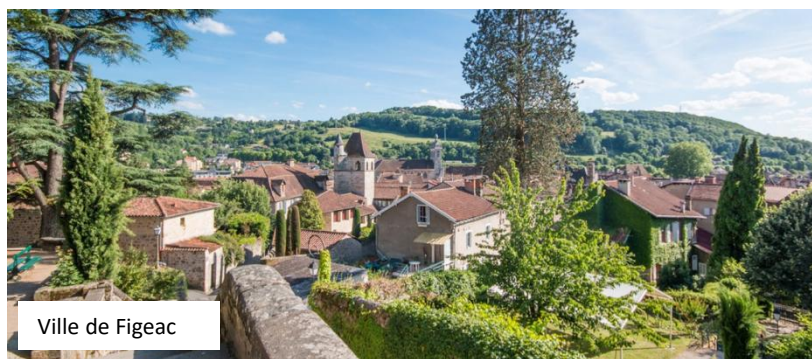
Ville de Figeac

Ville d'Art et d'Histoire, Figeac est aussi une cité médiévale pleine de charme en plein centre de la région Occitanie.